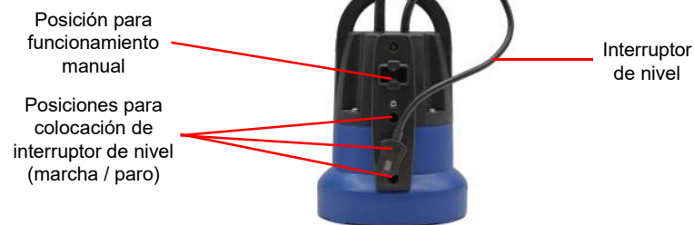
Figura 3 : Interruptor de nivel

⚡ La bomba no debe ser usada cuando haya personas en el agua. No tocar la bomba directamente con las manos mientras esté en funcionamiento.